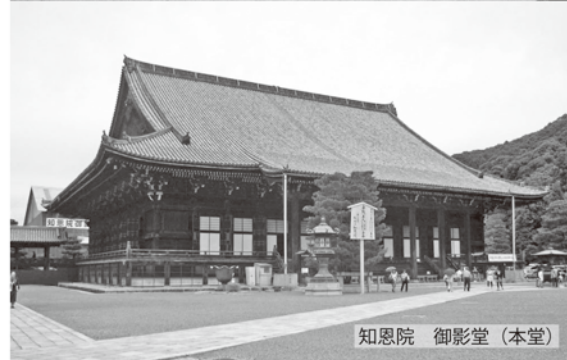
知恩院 御影堂(本堂)