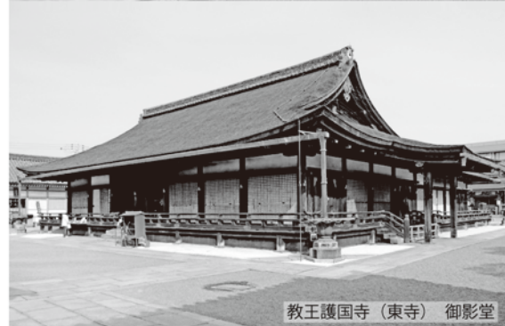
教王護国寺(東寺) 御影堂